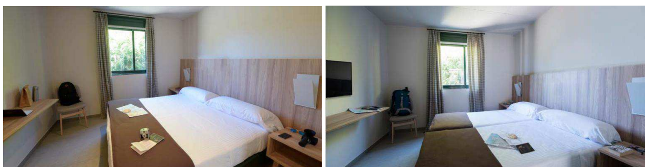
Habitaciones dobles con baño privado y 2 camas de 0,90 x 2 metros. Superficie 17,70 m 2